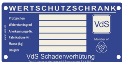
Beispiel Typenschild VdS-Tresore

Sehr geehrter Kunde, bitte bewahren Sie dieses PDF sorgfältig auf. Serienmäßig erhalten Sie mit Ihrem Tresor zwei Doppelschlüssel. Für Ersatz- oder Nachbestellungen verwenden Sie bitte dieses Formular. Bei Tresormodellen mit den hier abgebildeten Typenschildern können aus Sicherheitsgründen Ersatzschlüssel nur nach Vorlage eines Originalschlüssels angefertigt werden. Diese Vorschriften wurden zu Ihrer Sicherheit vom Verband der Schadenversicherer VdS in Köln herausgegeben.