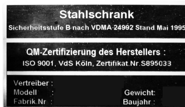
Beispiel Typenschild VDMA-Tresore